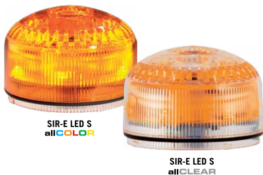
SIR-E LED S allCOLOR