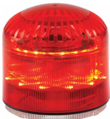
SIR-E LED MAX